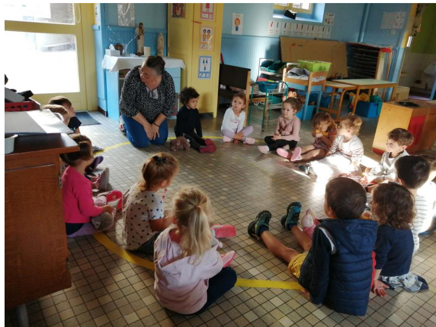
Les petits rituels du matin