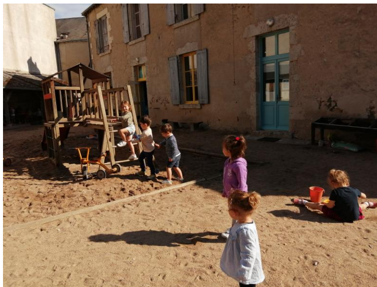
Et la récréation !!!