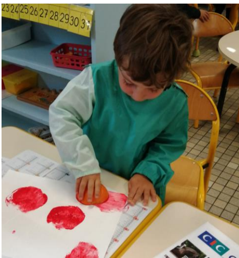
Temps de peinture